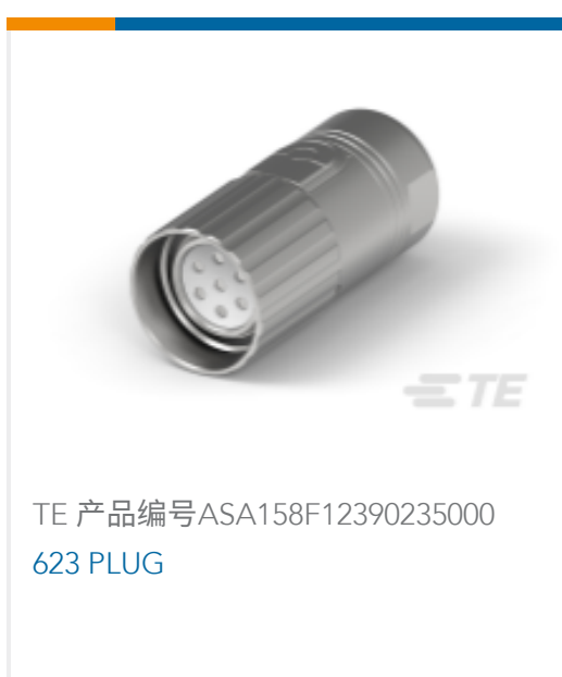
TE 产品编号ASA158F12390235000 623 PLUG