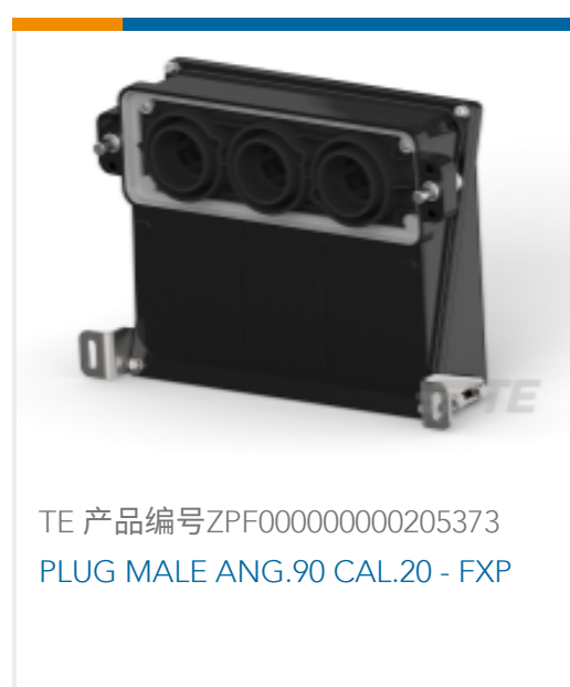
TE 产品编号ZPF000000000205373 PLUG MALE ANG.90 CAL.20 - FXP