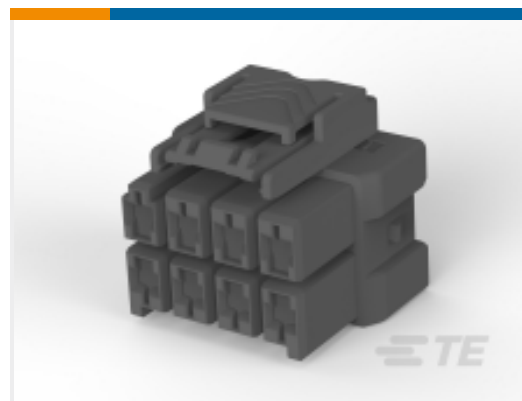
TE 产品编号5-2232357-4 POWER TRIPLE LOCK Glow Wire Plug