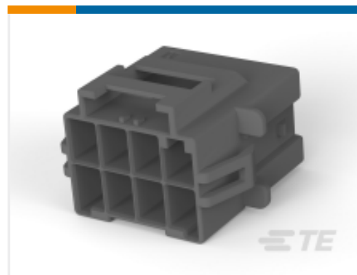
TE 产品编号7-2232263-3 三重锁定电源连接器：灼热丝帽