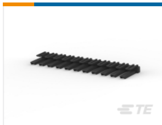
TE 产品编号1-1744544-1 EP II TPA 11P, BLACK