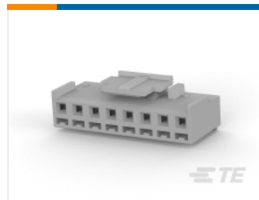
TE 产品编号1744497-8 08P EP-II HOUSING, GREY