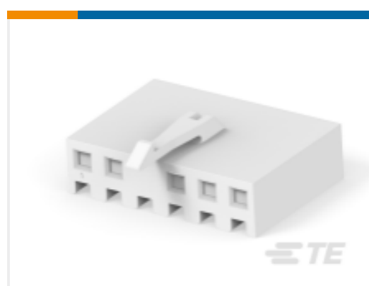
TE 产品编号2327576-1 06P SL156 HSG NO3P THRU BD LTH UL94V0