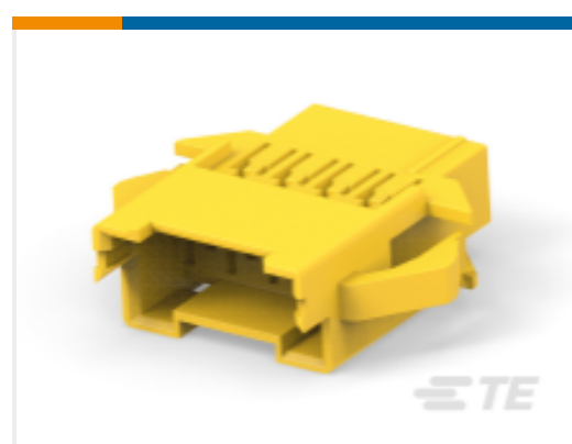
TE 产品编号6-2349952-4 HSG,REC,PANEL MOUNT,EP2.5, Yellow, 4P