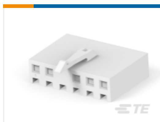
TE 产品编号2327576-1 06P SL156 HSG NO3P THRU BD LTH UL94V0