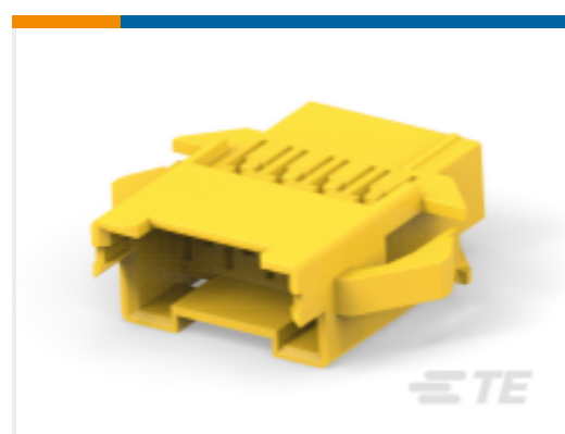
TE 产品编号6-2349952-4 HSG,REC,PANEL MOUNT,EP2.5, Yellow, 4P