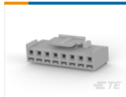
TE 产品编号1744497-8 08P EP-II HOUSING, GREY