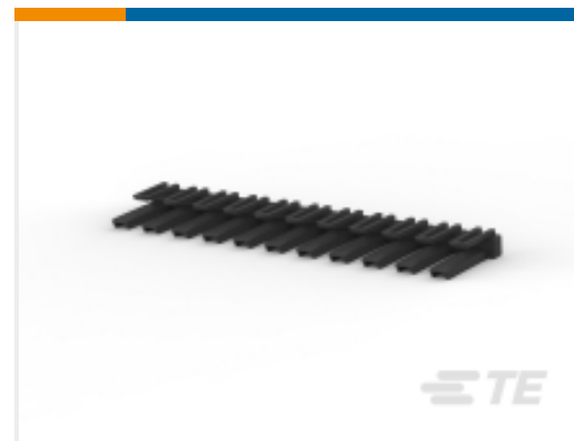
TE 产品编号1-1744544-1 EP II TPA 11P, BLACK