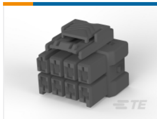
TE 产品编号5-2232357-4 POWER TRIPLE LOCK Glow Wire Plug