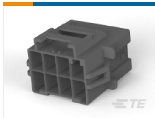
TE 产品编号7-2232263-3 三重锁定电源连接器：灼热丝帽