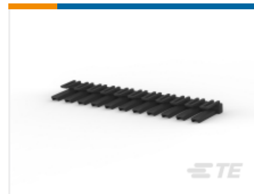
TE 产品编号1-1744544-1 EP II TPA 11P, BLACK