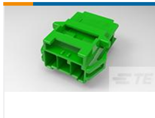
TE 产品编号7-2232263-3 PTL 1X3 CAP PANEL MT GLW WIRE KEY C GRN