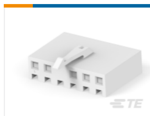
TE 产品编号2327576-1 06P SL156 HSG NO3P THRU BD LTH UL94V0