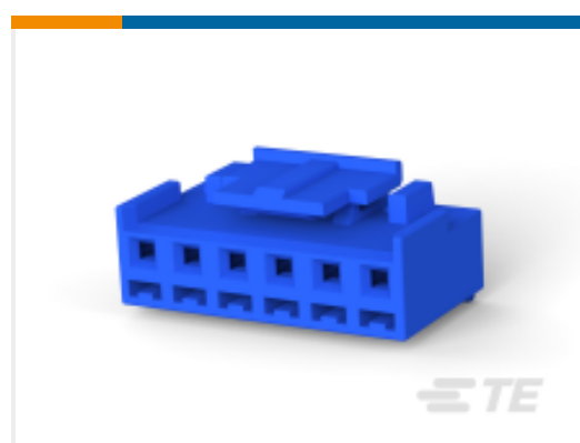
TE 产品编号1744496-6 06P EP-II HOUSING, BLUE