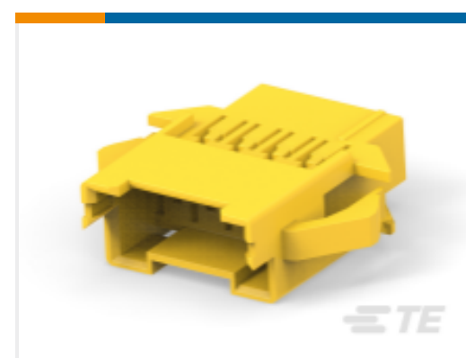
TE 产品编号6-2349952-4 HSG,REC,PANEL MOUNT,EP2.5, Yellow, 4P