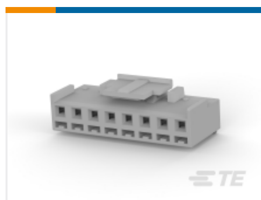
TE 产品编号1744497-8 08P EP-II HOUSING, GREY