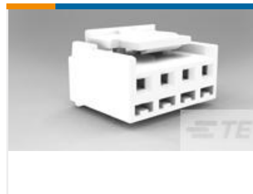
TE 产品编号1-2132781-1 11P EP-II HOUSING, NATURAL