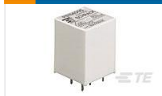
TE 产品编号2-1415030-1 PB134012