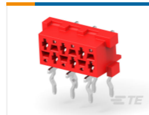
TE 产品编号 215460-6 MICRO-MATCH FEM.SE