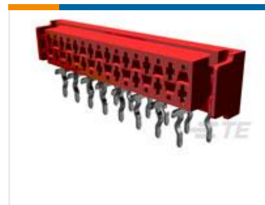
TE 产品编号 338070-6 MICRO-MATCH FEM.SE