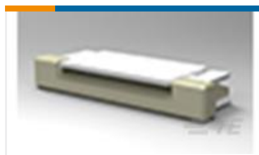
TE 产品编号1-1734839-6 FPC CONN. 0.5MM PITCH T/C, 16P