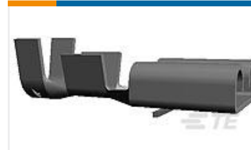
TE 产品编号1217281-2 FF 110 REC 24-20AWG TPBR