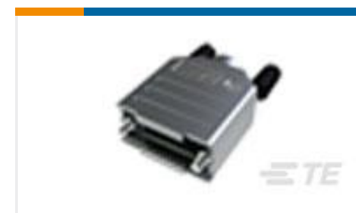
TE 产品编号2-2198617-5 Ni Plated Plastic Backshell, 25 Way, Str