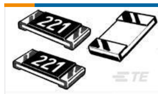
TE 产品编号1-2176070-0 3521 24R 1% 2W