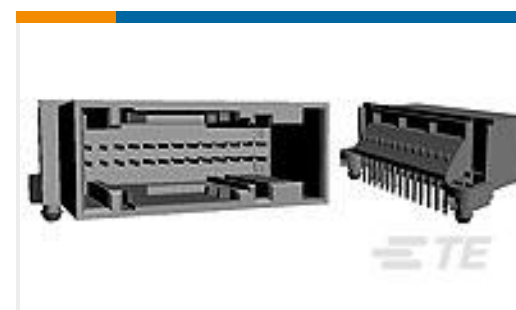
TE 产品编号185534-3 26pos MQS .63 header 90deg