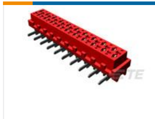
TE 产品编号 7-188431-6 MM 6p FIB SMD connector