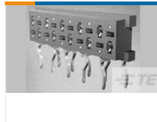
TE 产品编号 7-100400-6 MICRO-MATCH FSID NP