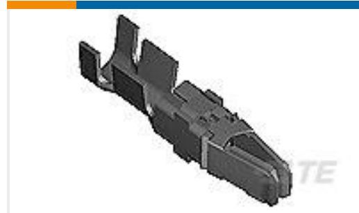
TE 产品编号66741-6 TYPE XII FEMALE CONT (L.P.)