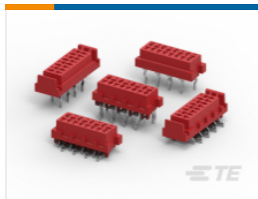
TE 产品编号 CAT-M5833-F3492A Female-on-Board Connector, Top Entry