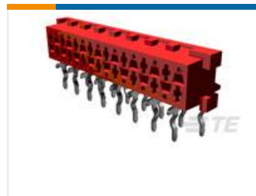
TE 产品编号 7-215460-6 MICRO-MATCH FSID P