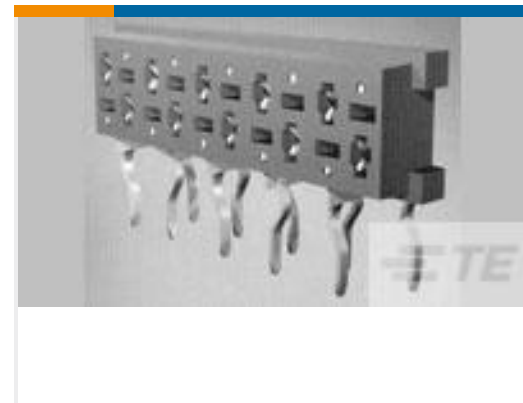
TE 产品编号 100400-6 MICRO-MATCH FSID NP