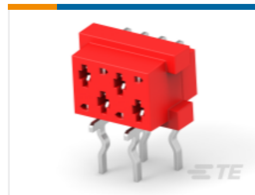
TE 产品编号 215460-4 MICRO-MATCH FEM.SE