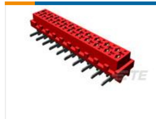
TE 产品编号 7-188431-4 MM 4P FIB SMD CONNECTOR