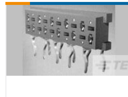
TE 产品编号 100400-4 MICRO-MATCH FSID NP