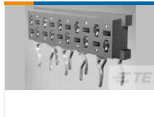
TE 产品编号 7-100400-4 NOT POLARIZED,BOX A 250ST