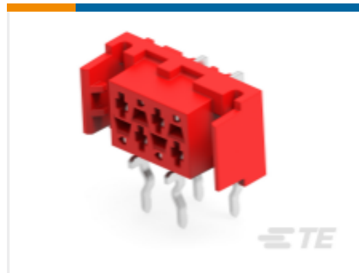
TE 产品编号 338070-4 MICRO-MATCH FEM.SE