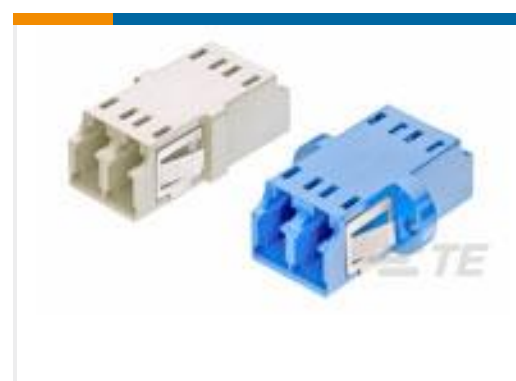
TE 产品编号6457567-5 ASSY, ADPTR, DUP, LC, SR BEIGE