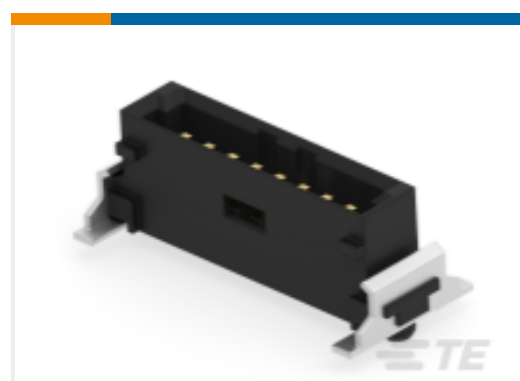
TE 产品编号284699-E SRCP 1,27 8 M 1 SMD 137 E1 094 * GU- H *