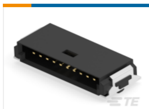
TE 产品编号234464-E SRCA 1,27 10 M 1 SMD 137 E1 094 * GURT *