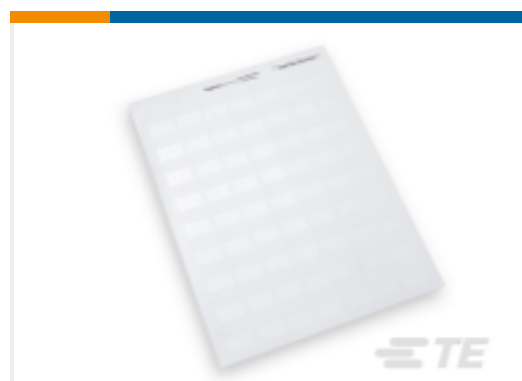
TE 产品编号9-1768016-1 CSL-06925P-9