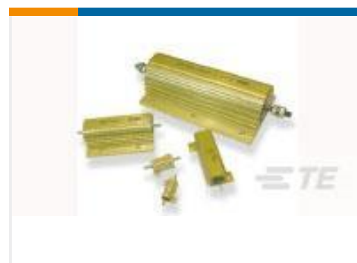
TE 产品编号7-1625966-5 HSA10 R47 5%