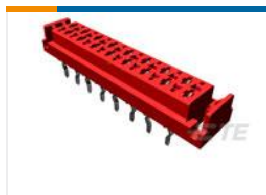
TE 产品编号1-338068-0 MICRO-MATCH FTE,10P