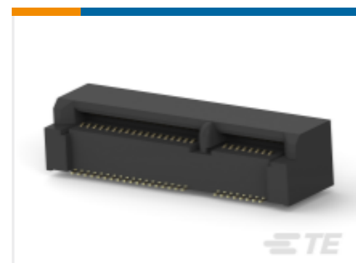
TE 产品编号1759547-1 mSATA/mini PCI-E 7H G/F