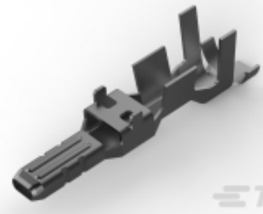
TE 产品编号 1971788-2 PTL TAB CONTACT, 2X18 AWG