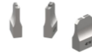
ANVIL REPRESENTATION ONLY TE 产品编号 1-1803079-5 ANVIL