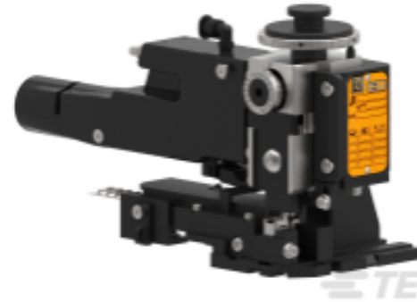
TE 产品编号 2151745-2 OCEAN_2.0_Applicator-S-090F130F-RSA