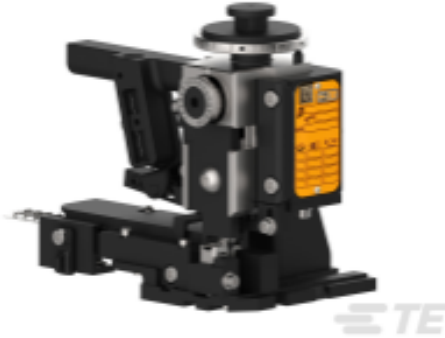
TE 产品编号 2151745-1 OCEAN_2.0_Applicator-S-090F130F-RSM