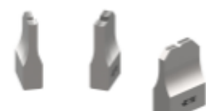
ANVIL REPRESENTATION ONLY