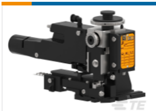
TE 产品编号 2151160-2 OCEAN_2.0_APPLICATOR-S-110F140OV-RSA