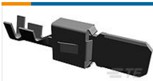
TE 产品编号 964306-1 TAB A 5.8x0.8 CONTACT CF SRC Sn