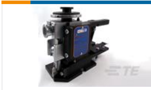
TE 产品编号2150371-1 OCEAN_2.0_Applicator-E-160F210F- REM