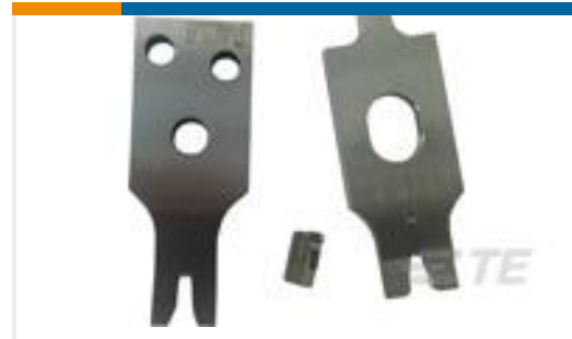
TE 产品编号7-2150371-7 OCEAN_2.0_SPARE_PART_KIT- 160F210F