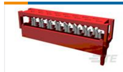
TE 产品编号215083-8 MICRO-MATCH MOW.08P