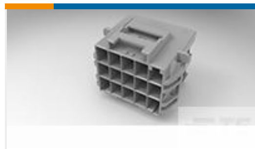
TE 产品编号5-1971875-7 PTL 3X5 CAP PANEL MT HITEMP KEY A LGR