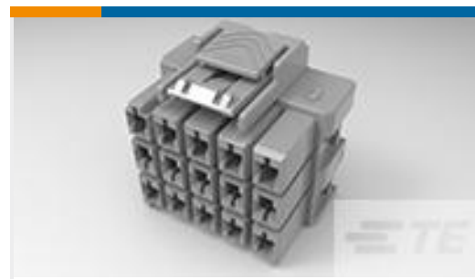
TE 产品编号5-1971876-7 PTL 3X5 PLUG HSG HIGH TEMP KEY A LGR