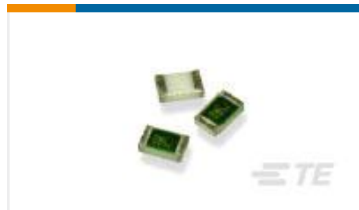
TE 产品编号9-1676481-2 CPF 0603 56K 0.1% 25PPM 1K RL