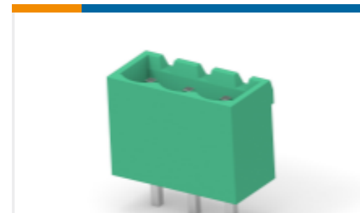
TE 产品编号2351885-3 3POS TB HDR 180 DEG, PITCH 5.0&TL 4.5mm