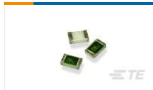
TE 产品编号6-1879212-7 CPF 0402 10R7 0.1% 25PPM 1K RL