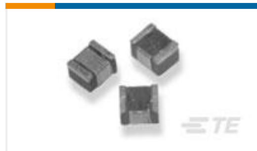
TE 产品编号3-1624113-6 3650 0805 33nH 5% 2K RL