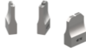
ANVIL REPRESENTATION ONLY