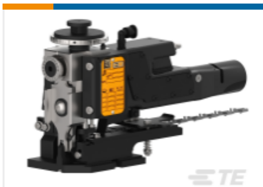
TE 产品编号2150585-2 OC-AT-E-FA-210F250F-001-0256