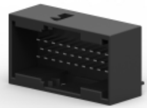
TE 产品编号967387-1 29pos header 180deg PF AP