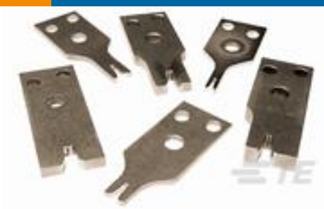
TE 产品编号9-1633588-0 CRIMPER, WIRE 'F'.133