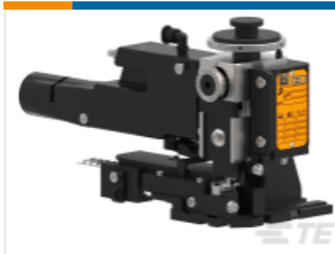
TE 产品编号2837581-2 OCEAN-2.0-APPLICATOR-SA