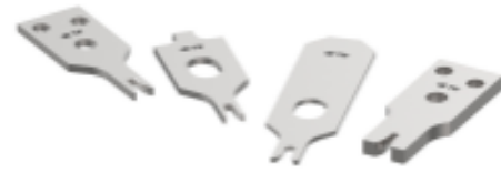
CRIMPER REPRESENTATION ONLY