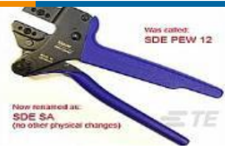
TE 产品编号2063524-1 SDE MCP1.5 0.2-1.0mm2 ASSY