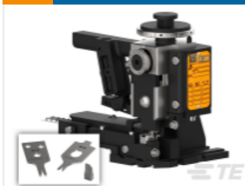
TE 产品编号7-2836551-1 OCEAN_2.0_Applicator-S-064F144O