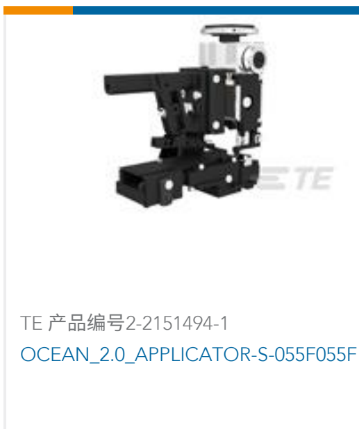
TE 产品编号2-2151494-1 OCEAN_2.0_APPLICATOR-S-055F055F