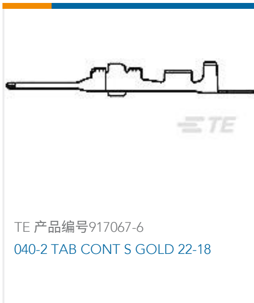
TE 产品编号917067-6 040-2 TAB CONT S GOLD 22-18