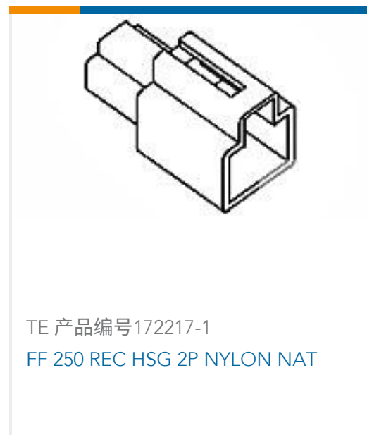
TE 产品编号172217-1 FF 250 REC HSG 2P NYLON NAT