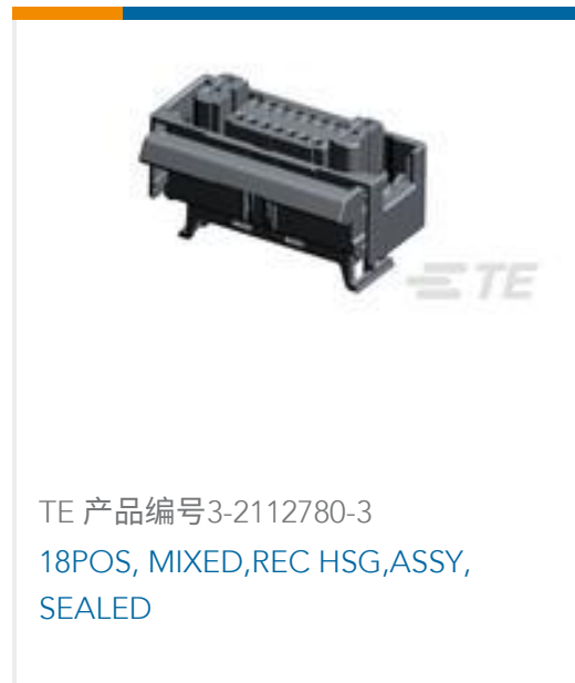
TE 产品编号3-2112780-3 18POS, MIXED, REC HSG, ASSY, SEALED