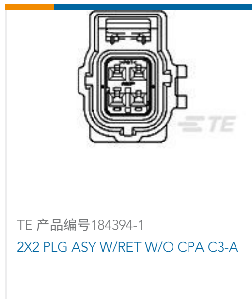
TE 产品编号184394-1 2X2 PLG ASY W/RET W/O CPA C3-A