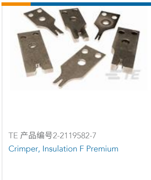
TE 产品编号2-2119582-7 Crimper, Insulation F Premium