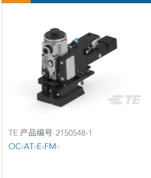
TE 产品编号 2150548-1 OC-AT-E-FM-