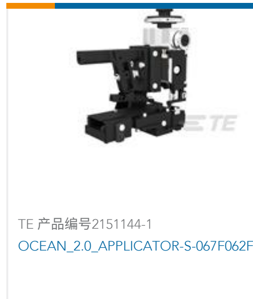
TE 产品编号2151144-1 OCEAN_2.0_APPLICATOR-S-067F062F