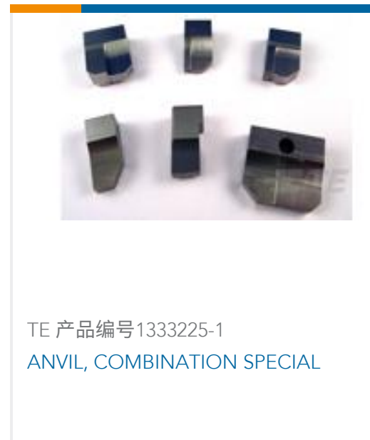
TE 产品编号1333225-1 ANVIL, COMBINATION SPECIAL