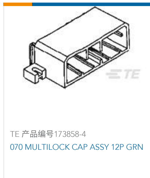
TE 产品编号173858-4 070 MULTILOCK CAP ASSY 12P GRN