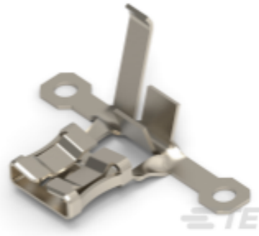
TE 产品编号 2178439-1 250 FASTON, FLAG, REC., 16-12 AWG, PNST