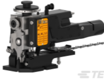
TE 产品编号 2150336-2 OCEAN_2.0_APPLICATOR-S- 100F180SP