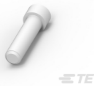
TE 产品编号 114017-ZZ SEALING PLUG, SIZE 12/16, WHT