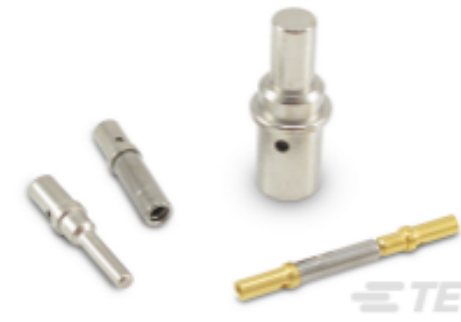
TE 产品编号 0460-202-16141 DEUTSCH Solid Contacts