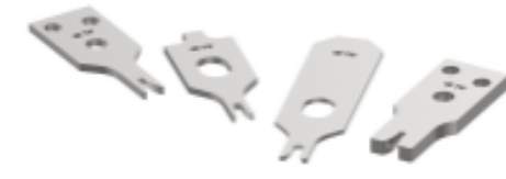
CRIMPER REPRESENTATION ONLY