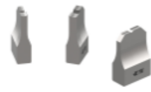
ANVIL REPRESENTATION ONLY