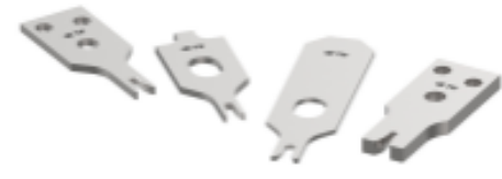
CRIMPER REPRESENTATION ONLY