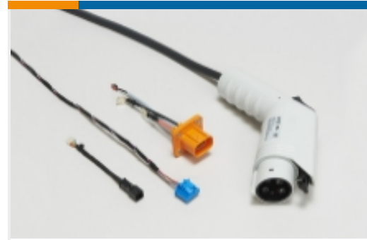
电动、混合动力和燃料电池线束(79)