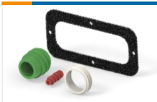
连接器密封件和盲堵(5)