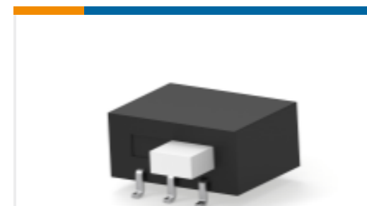
TE 产品编号1-1437581-1 ASE22RL=AUTOSLIDE DP