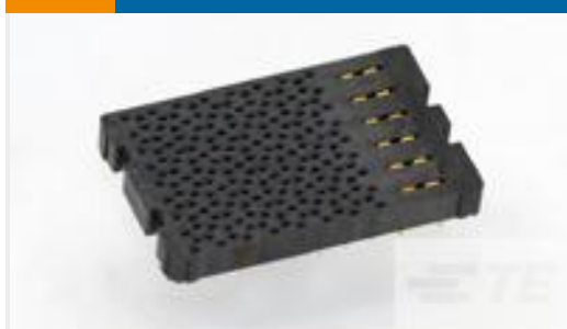
TE 产品编号 5-2057461-1 STRADA MESA,RC,ST,056,000,06,SN, N,NA