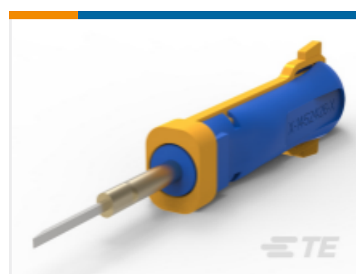
TE 产品编号 1452426-1 EXTRACTION TOOL