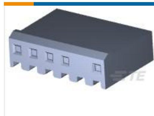
TE 产品编号644233-6 06P SL156 HSG W/RAMP W/O#5