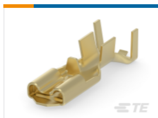
TE 产品编号2238285-1 POS LOCK 250 REC, MKII, 18-14 BR