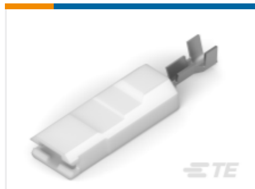
TE 产品编号1969161-5 ULTRA-POD 250 ASY REC 0.3-0.8 MM2 TPBR