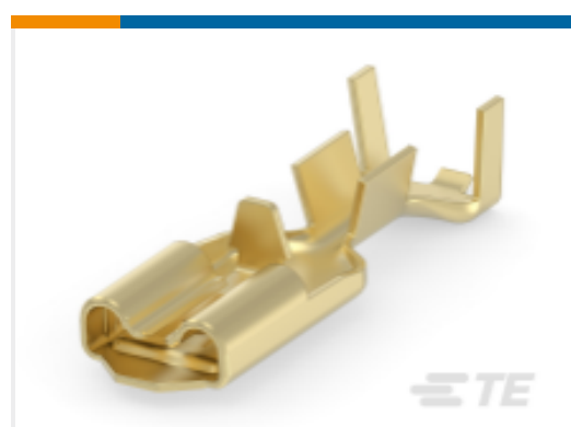
TE 产品编号2238278-1 POSLOCK 250 REC, MKII, 18-14 BR