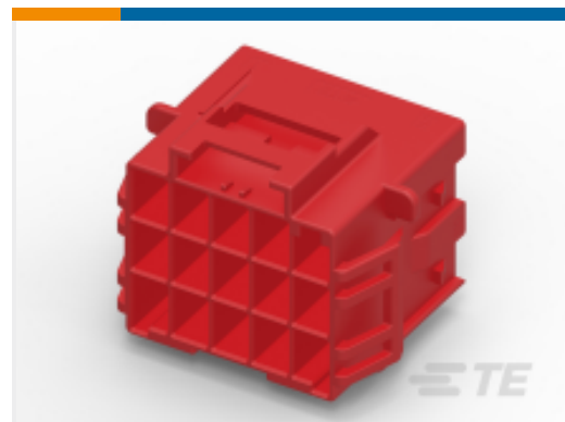
TE 产品编号6-1971775-5 POWER TRIPLE LOCK High Temperature Caps