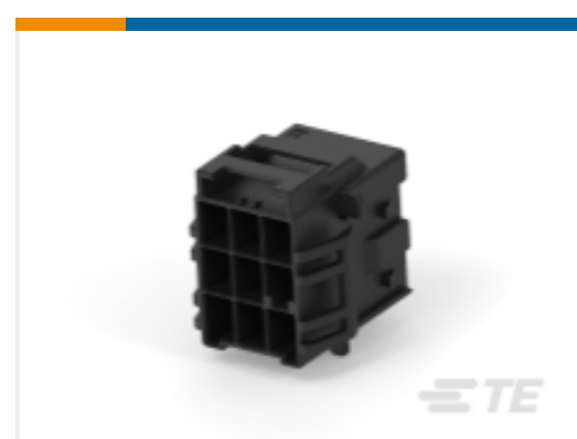
TE 产品编号 7-1971875-3 PTL 3X3 CAP PANEL MT HITEMP KEY C BLK