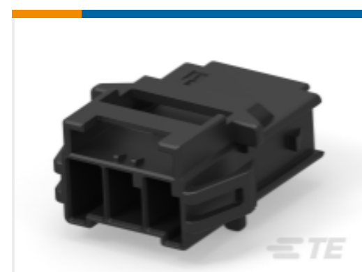
TE 产品编号1-2232263-2 PTL 1X3 CAP PANEL MT HOT WIRE KEY A BLK