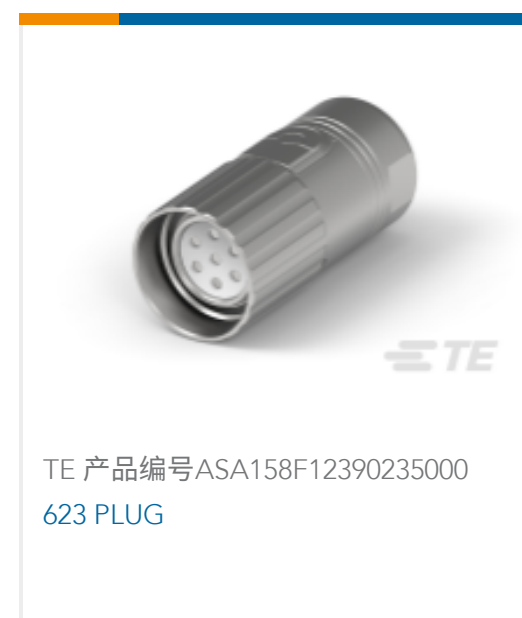
TE 产品编号ASA158F12390235000 623 PLUG