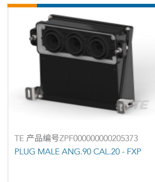
TE 产品编号ZPF000000000205373 PLUG MALE ANG.90 CAL.20 - FXP