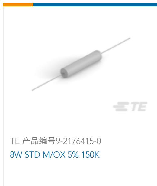
TE 产品编号 9-2176415-0 8W STD M/OX 5% 150K