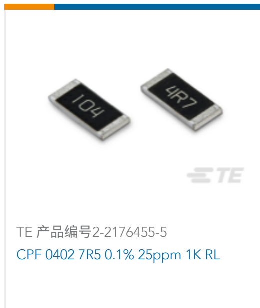
TE 产品编号 2-2176455-5 CPF 0402 7R5 0.1% 25ppm 1K RL