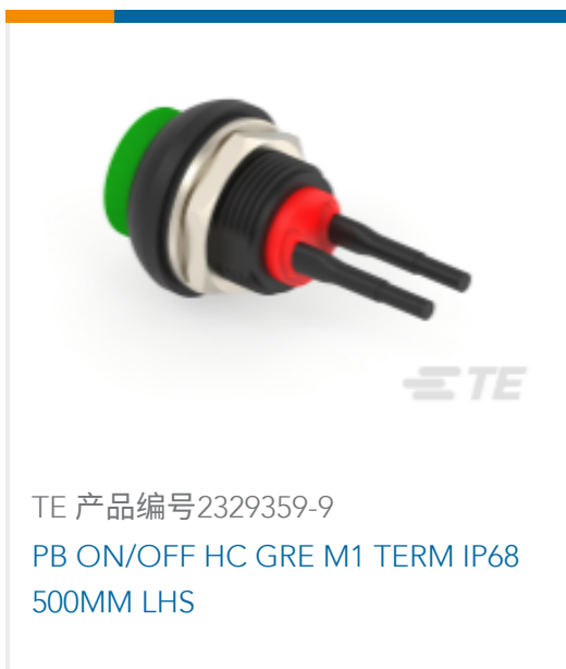
TE 产品编号 2329359-9 PB ON/OFF HC GRE M1 TERM IP68 500MM LHS