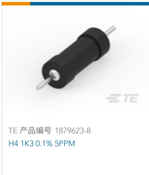
TE 产品编号 1879623-8 H4 1K3 0.1% 5PPM