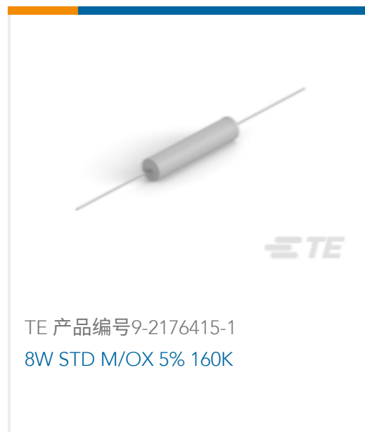
TE 产品编号 9-2176415-1 8W STD M/OX 5% 160K