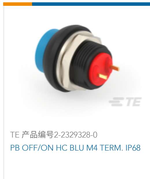
TE 产品编号 2-2329328-0 PB OFF/ON HC BLU M4 TERM. IP68