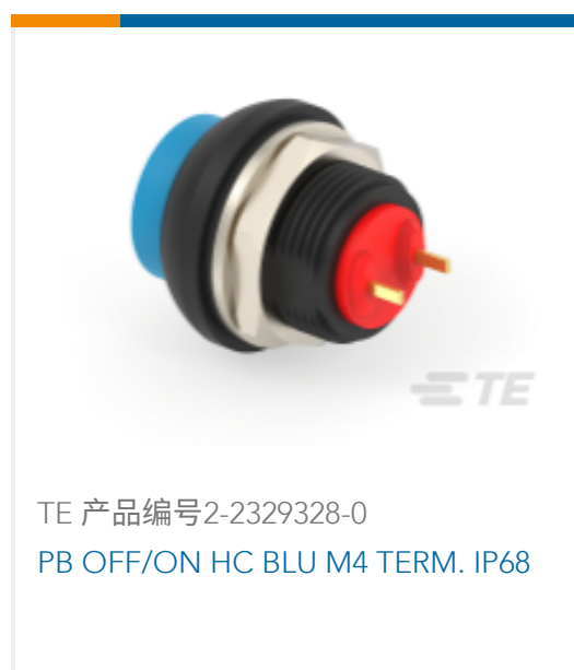
TE 产品编号 2-2329328-0 PB OFF/ON HC BLU M4 TERM. IP68