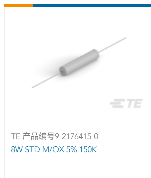
TE 产品编号 9-2176415-0 8W STD M/OX 5% 150K