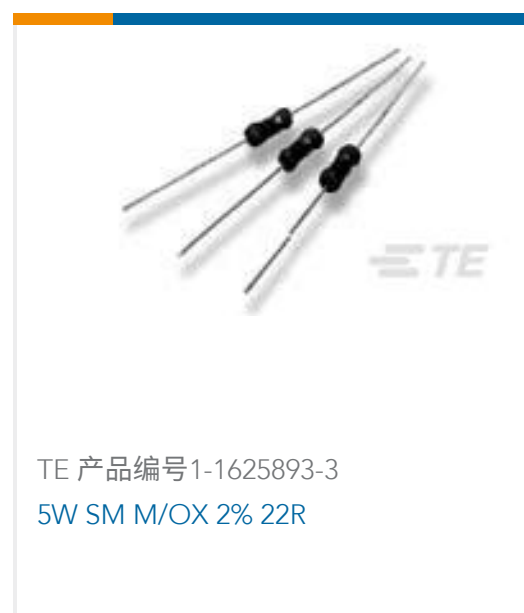
TE 产品编号 1-1625893-3 5W SM M/OX 2% 22R