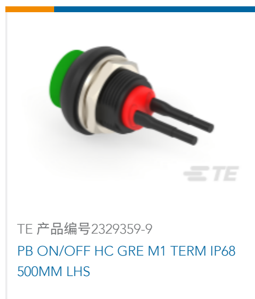
TE 产品编号 2329359-9 PB ON/OFF HC GRE M1 TERM IP68 500MM LHS