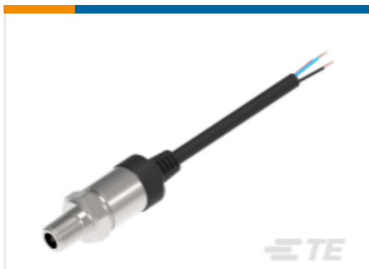
TE 产品编号20014203-12 PRESS XDCR M325M-000005-250PG