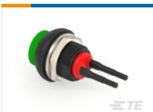
TE 产品编号2329359-9 PB ON/OFF HC GRE M1 TERM IP68 500MM LHS