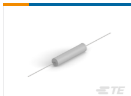
TE 产品编号9-2176415-0 8W STD M/OX 5% 150K