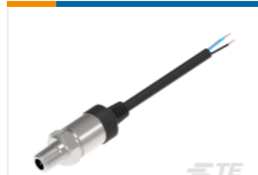
TE 产品编号20014203-12 PRESS XDCR M325M-000005-250PG