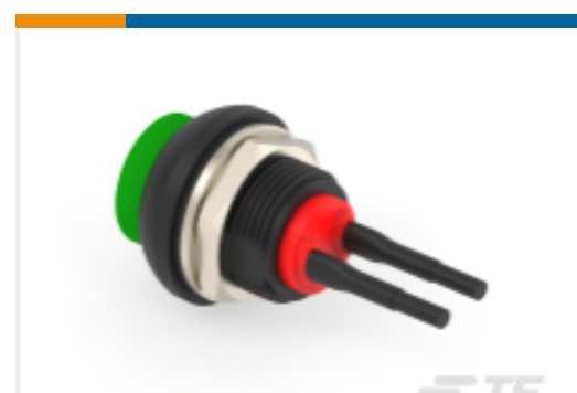
TE 产品编号2329359-9 PB ON/OFF HC GRE M1 TERM IP68 500MM LHS