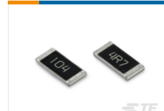
TE 产品编号2-2176455-5 CPF 0402 7R5 0.1% 25ppm 1K RL