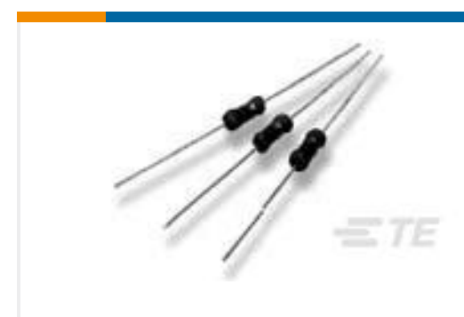
TE 产品编号1-1625893-3 5W SM M/OX 2% 22R