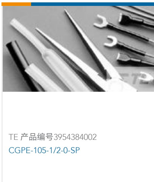
TE 产品编号3954384002 CGPE-105-1/2-0-SP