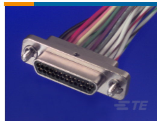
TE 产品编号1-1532186-0 M83513/03-H14N, MCKS-N1-B-100P6G9-72.0