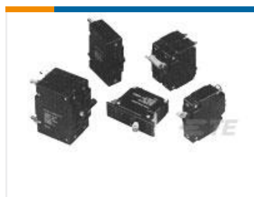
TE 产品编号2-1393255-3 W94-X113-30=M6/M7/M9/W6/W7