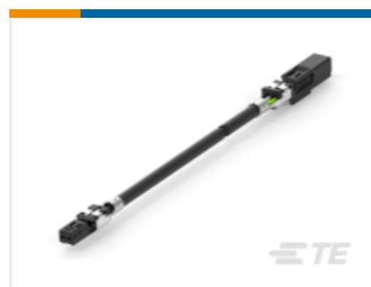
TE 产品编号2362767-5 MATENET,CABLE ASSY,1 GBPS UTP