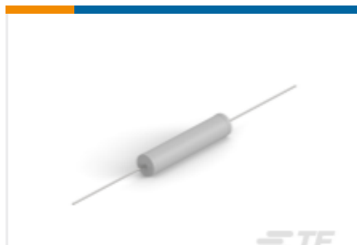
TE 产品编号9-2176415-0 8W STD M/OX 5% 150K