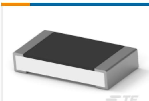
TE 产品编号1-2176391-0 RQ 1206 15K4 0.1% 10PPM 5K RL