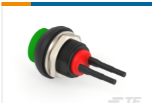
TE 产品编号2329359-9 PB ON/OFF HC GRE M1 TERM IP68 500MM LHS