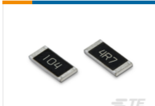
TE 产品编号2-2176455-5 CPF 0402 7R5 0.1% 25ppm 1K RL