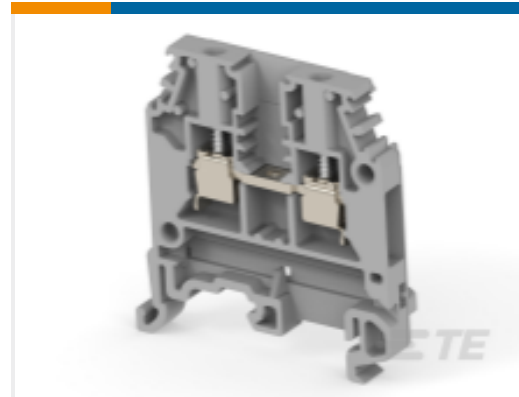
TE 产品编号1SNA115486R0300 MA2.5/5