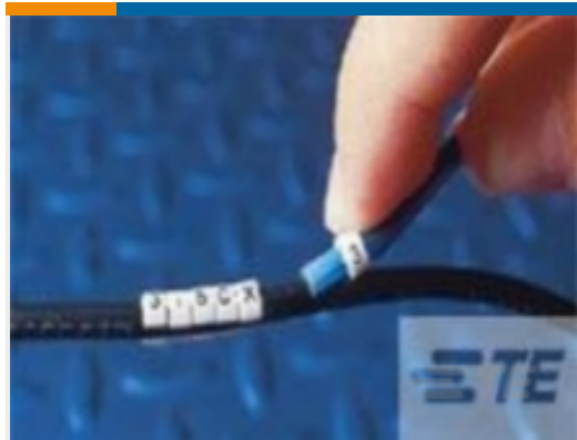
TE 产品编号9-1768046-7 STD17Y-T