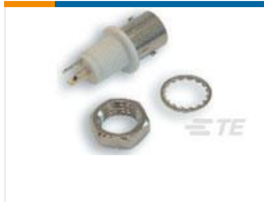
TE 产品编号1-1337447-0 BNC Ins BHSkt 50Ohm Nickel Silver Pltd