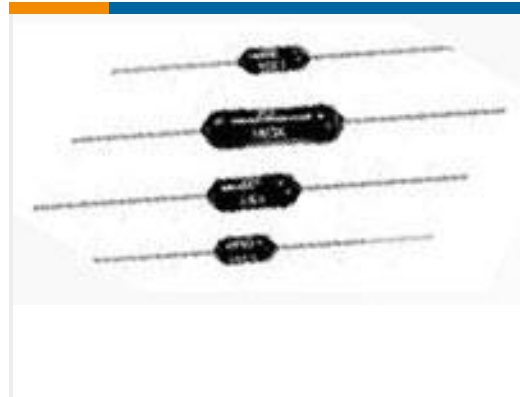
TE 产品编号2-1879665-1 H8 20K 0.1% 15PPM