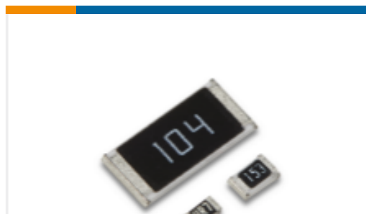
TE 产品编号3-2176347-3 CRGCQ 2010 4K7 1%