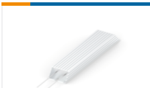
TE 产品编号1-2176505-0 CJP 120W 39R 5% Lead