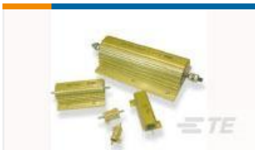
TE 产品编号1630019-7 HSC200 180R 5%