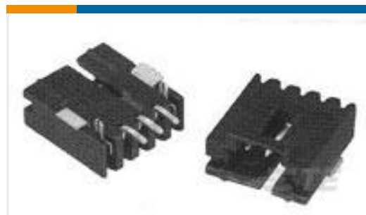
TE 产品编号147323-3 04 MTE HDR SRRA SMT.100CL