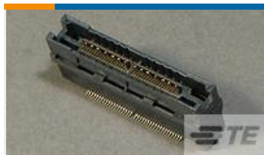
TE 产品编号5767130-2 MICT,RCPT,076,ASY,GOLD,EXTD