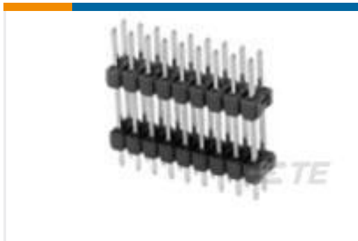
TE 产品编号5-146496-2 04 MODII HDR DRST UNSHRD STKG