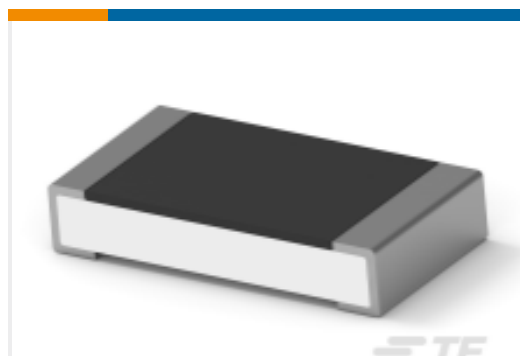
TE 产品编号1-2176391-0 RQ 1206 15K4 0.1% 10PPM 5K RL