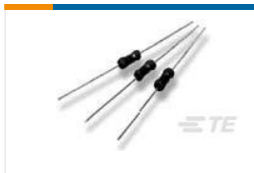
TE 产品编号1-1625893-3 5W SM M/OX 2% 22R