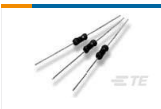
TE 产品编号1-1625893-3 5W SM M/OX 2% 22R