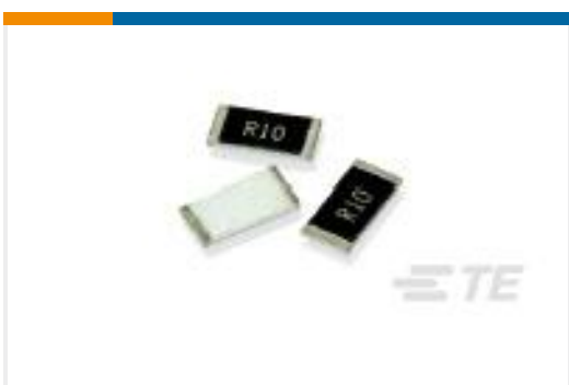
TE 产品编号2-1879461-5 RL73H 2A R13 1% 1K RL