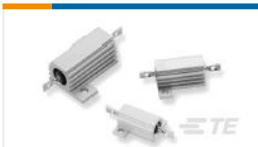
TE 产品编号1879075-9 THS25 R47 5%