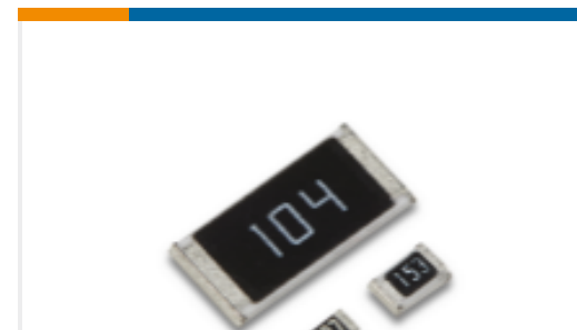
TE 产品编号3-2176337-6 CRGCO 0402 8K2 1%