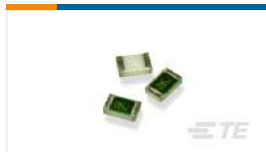
TE 产品编号9-1614882-9 CPF 0603 22R 0.1% 25PPM 1K RL