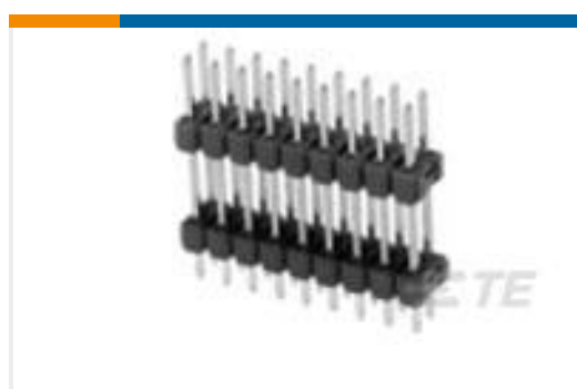
TE 产品编号5-146496-2 04 MODII HDR DRST UNSHRD STKG