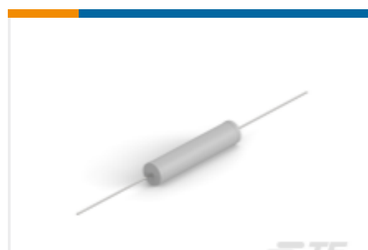
TE 产品编号9-2176415-1 8W STD M/OX 5% 160K