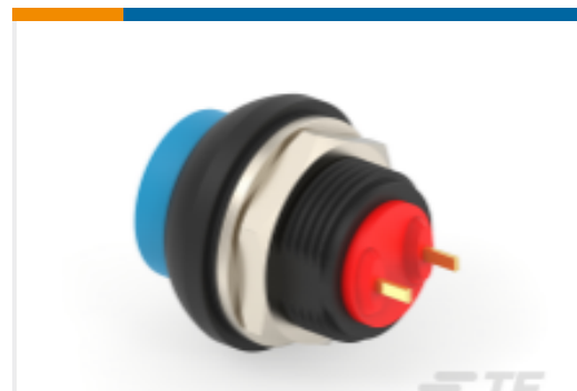
TE 产品编号2-2329328-0 PB OFF/ON HC BLU M4 TERM. IP68