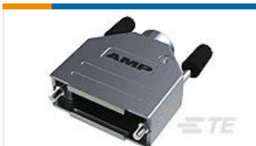
TE 产品编号1-1478762-5 METAL BACKSHELL 15 WAY TOP E