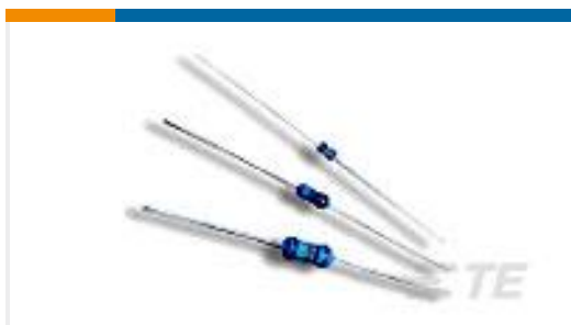
TE 产品编号1622796-1 YR1 0.1% 100K