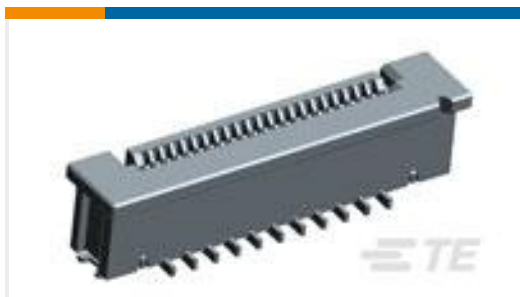
TE 产品编号2-1734742-0 .5 FPC VT ZIF Type-A 20 CONT