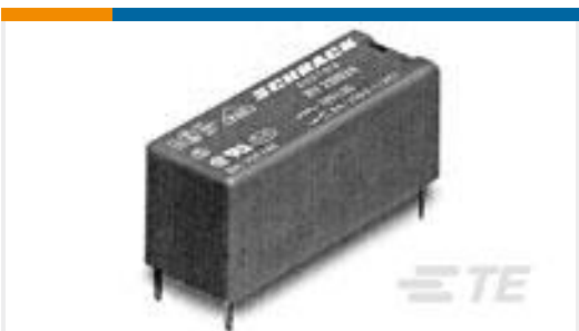
TE 产品编号4-1393224-9 RY211024