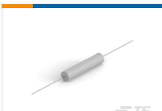
TE 产品编号9-2176415-1 8W STD M/OX 5% 160K