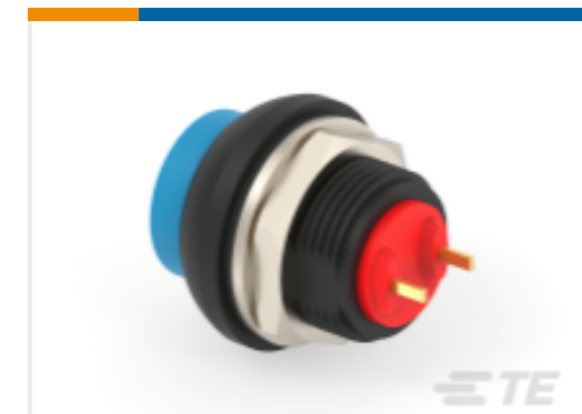
TE 产品编号 2-2329328-0 PB OFF/ON HC BLU M4 TERM. IP68