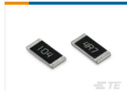
TE 产品编号 2-2176455-5 CPF 0402 7R5 0.1% 25ppm 1K RL