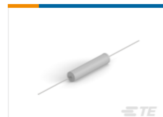
TE 产品编号 9-2176415-1 8W STD M/OX 5% 160K