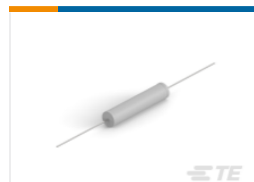
TE 产品编号 9-2176415-0 8W STD M/OX 5% 150K