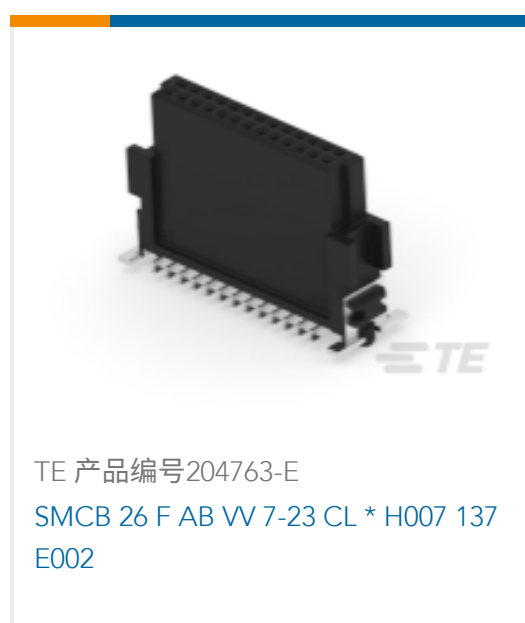
TE 产品编号204763-E SMCB 26 F AB VV 7-23 CL * H007 137 E002