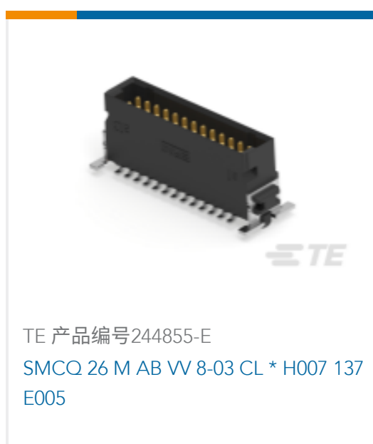
TE 产品编号244855-E SMCQ 26 M AB VV 8-03 CL * H007 137 E005