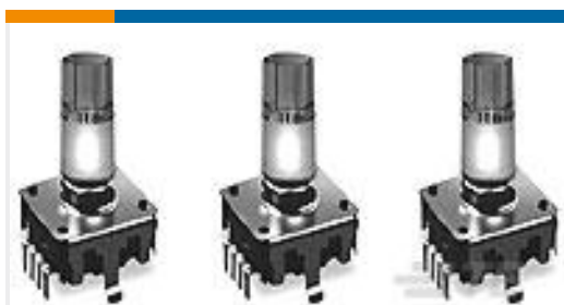
TE 产品编号 1-1879749-7 LED ENCODER 12MM HORIZ SW GR /RD