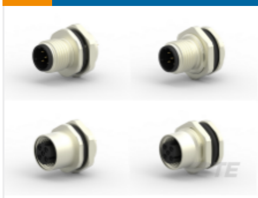
TE 产品编号T4133012051-000 M12 面板安装焊杯