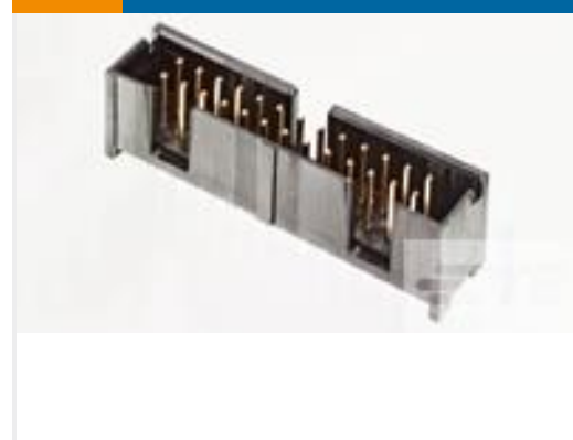
TE 产品编号2-1761603-9 IDC LOW PRO HDR 26P VERT BLUE