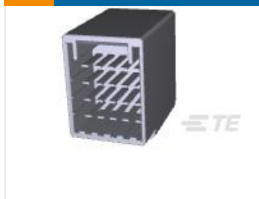
TE 产品编号917251-2 DYNAMIC D-3400F HDR ASSY 20P H