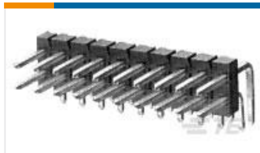
TE 产品编号826662-4 4P AMPMODU II STIFT LEI