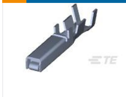
TE 产品编号175196-3 DYNAMIC D-3 REC CONT/L AU 0.76