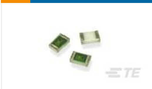
TE 产品编号1676258-2 RN 0805 22K6 0.1% 10PPM 1KRL