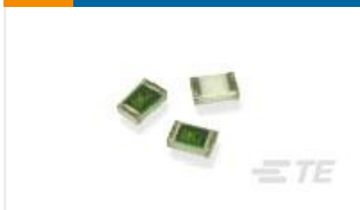
TE 产品编号1676309-1 RN 0805 348R 0.1% 10PPM CUT LE