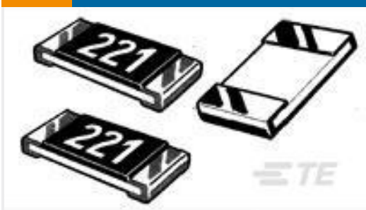
TE 产品编号4-2176231-1 3522 470R 1% 3W