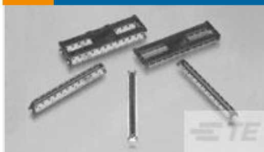
TE 产品编号3-1827233-6 .5FHP05H,440,B,GIG,08/Sn,HT,NS