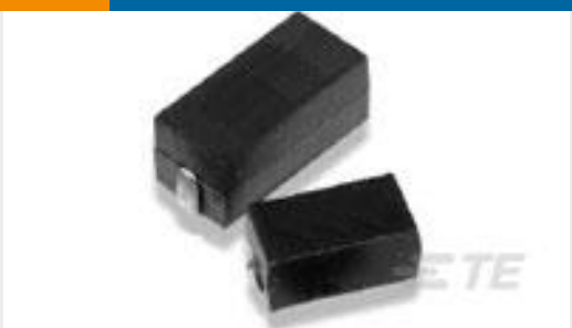
TE 产品编号7-1879233-7 SMW5 150R 5%