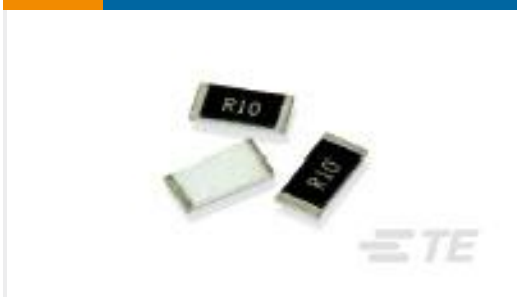
TE 产品编号1-2176055-5 RLP73M 2B R039 1% 1K RL