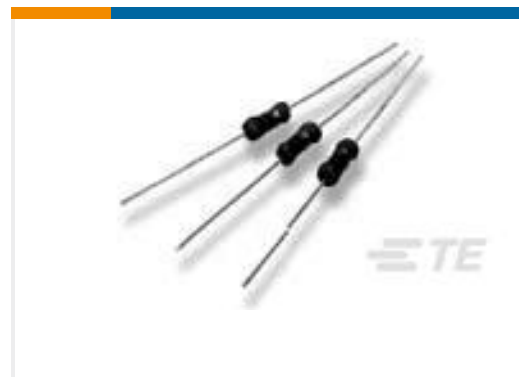
TE 产品编号1-1879353-9 RR02 5% 24K AMMO