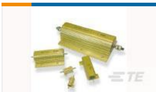
TE 产品编号9-1625971-5 HSA25 R01 10%