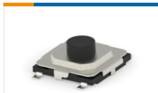
TE 产品编号2337238-3 TACT MINI GW 5.2X5.2X2 160GF