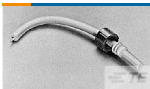
TE 产品编号1-830611-0 LGH 1/2 SNGL MLD END