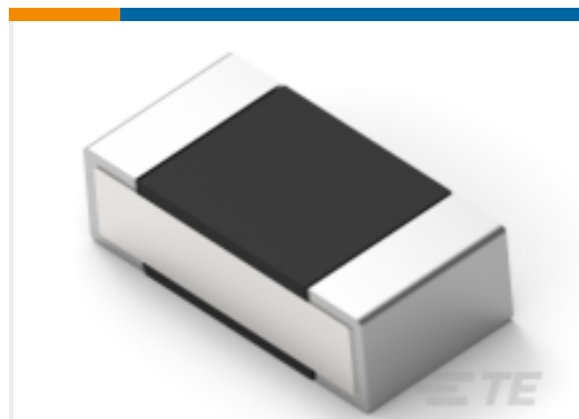
TE 产品编号7-2176305-3 RP 1E 0.1W 604R 0.1% 25PPM 5K RL