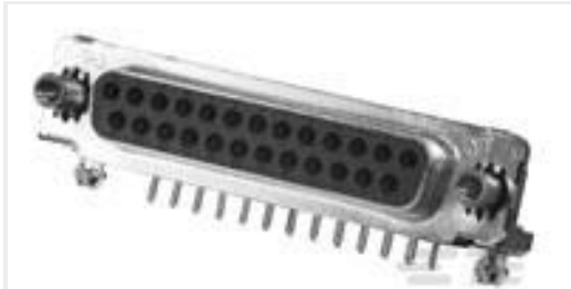
TE 产品编号6-747844-9 9P RA MSFL 318 RCPT