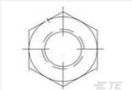
TE 产品编号1-328690-2 JAM NUT, GOLD PLATED