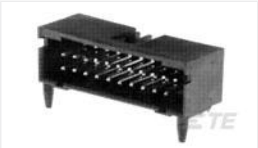
TE 产品编号5-104319-2 20 MODII HDR DRRA SHRD LF