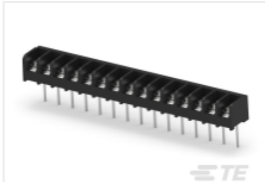
TE 产品编号2-796608-3 6WWV-15-008=#6 TRIBARRIER