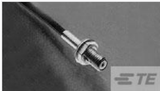
TE 产品编号2-330312-2 MINIATURE THREADED RECEPTACLES