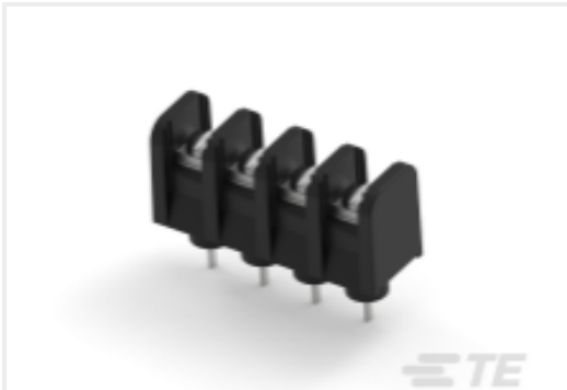
TE 产品编号1986563-4 SSB7TP040402=TERM BLOCK ASSY