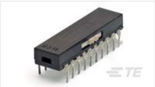
TE 产品编号6-1825011-4 ASF62RG04=6PDT AUTOSLIDE