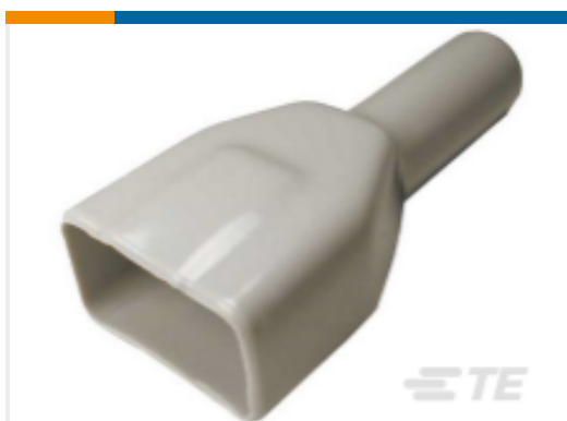
TE 产品编号DT12P-BT BOOT, 12P, REC, ST, GRY