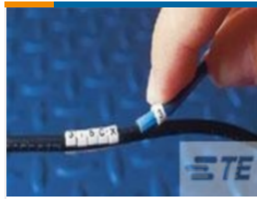
TE 产品编号064090-000 STD09Y-1