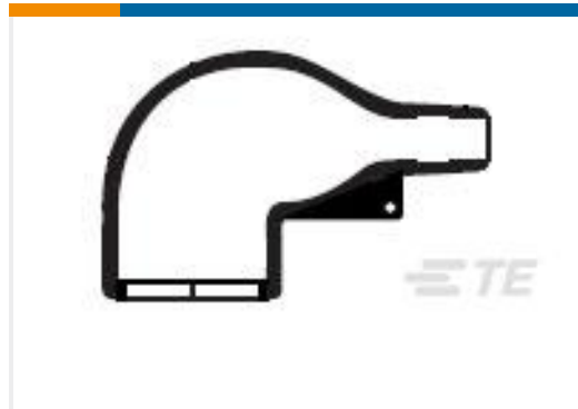
TE 产品编号117451-000 222K121-25/225-0