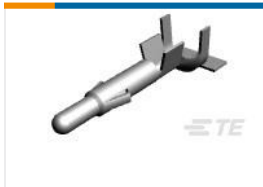
TE 产品编号926868-3 UNIV-MNL PIN 1