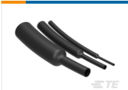
TE 产品编号1243436001 CGPT-R-19-0