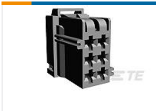
TE 产品编号8-968970-2 MCP2.8 GEH ASSY 6P