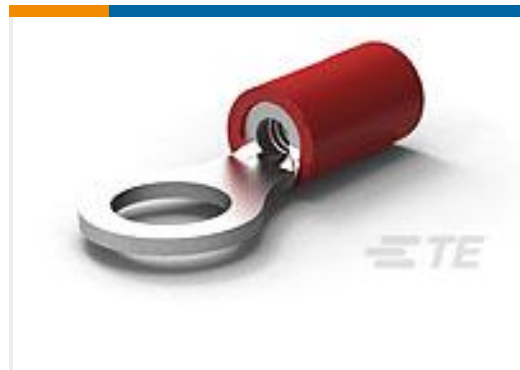
TE 产品编号130014 TERM, R, PG, 22-16, M5