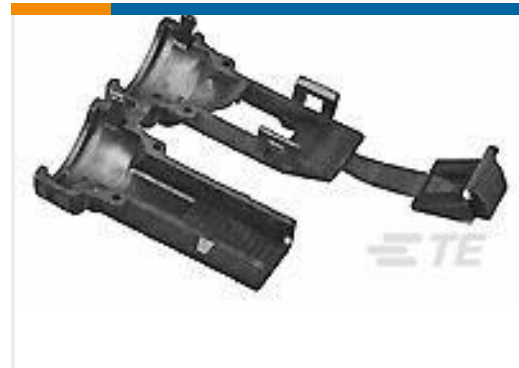
TE 产品编号965784-1 connector ABDECKKAPPE 180GRD