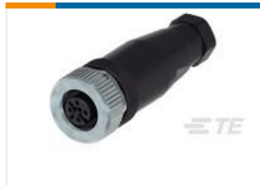
TE 产品编号6-2271116-2 M12, FEMALE, A CODE, 12P, PG9 (AU)