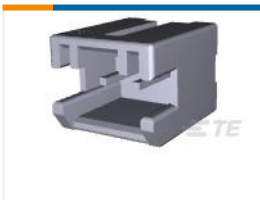
TE 产品编号1376478-2 2.5 SMC HDR 2POS WHITE (LP)