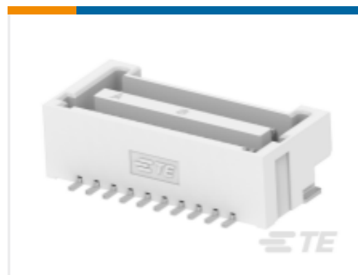
TE 产品编号2-2456589-0 Header Assy, 20pos, VT, KeyA, SGI 1.25