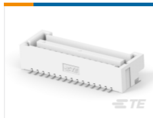
TE 产品编号3-2456589-0 Header Assy, 30pos, VT, KeyA, SGI 1.25