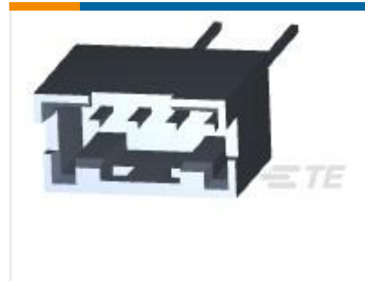
TE 产品编号5-1747072-4 GRACE INERTIA CONN 2.5 ON TAPE HDR 4P NA