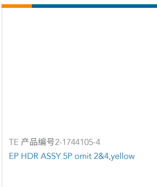
TE 产品编号2-1744105-4 EP HDR ASSY 5P omit 2&4,yellow