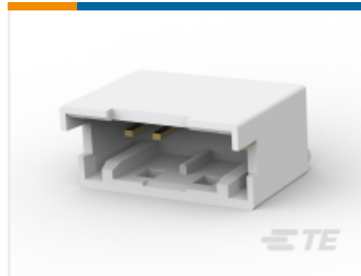
TE 产品编号1827738-1 GIC 2.5 HDR ASSY SPECIAL 3/5P