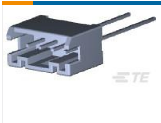
TE 产品编号5-1376492-4 2.5 SMC HDR 4POS WHITE TAPE