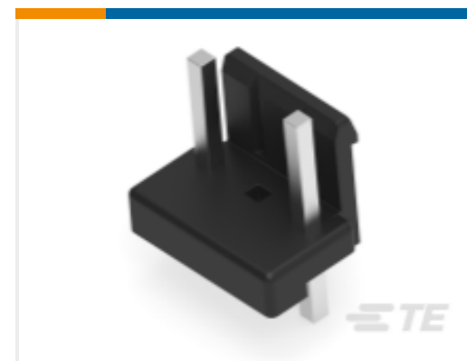
TE 产品编号5-1744103-1 EP HDR ASSY 3P omit 2,black