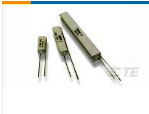
TE 产品编号1-1623726-0 SBCH 6 1R0 5%