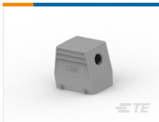
TE 产品编号T1319320120-000 H32A-TS-M20