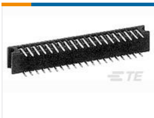
TE 产品编号7-532956-0 130 MODII 2PC CE RCPT ASSY, RoHS