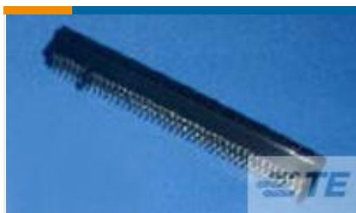
TE 产品编号 1734774-1 PCI EXP 3.1L 36 POS WHT G/F