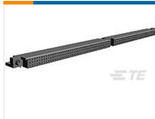
TE 产品编号5533514-6 ASSY,RECPT,R.ANGLE,HDI,LEAD-FR