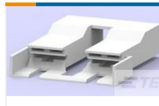
TE 产品编号1-521253-3 PL MKIII & FASTON 250 HSG 2P NYLON GREEN