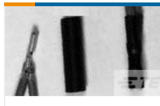
TE 产品编号440452-000 RT-3-NO.1-0-2.25IN