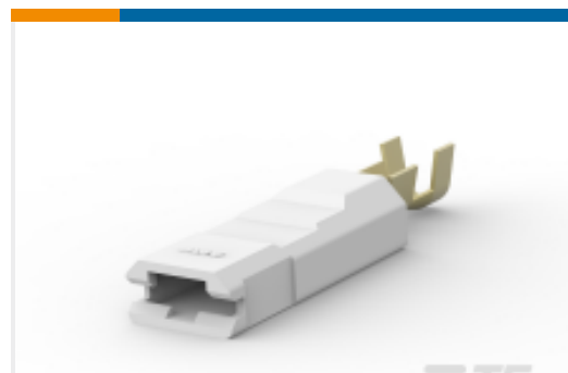
TE 产品编号1969104-1 ULTRA POD：直形，母端组件，无镀层，0.250 英寸