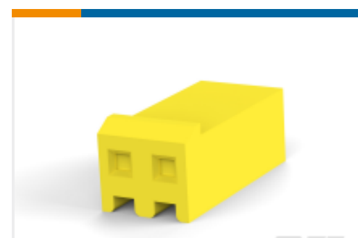
TE 产品编号644267-2 SL156 HSG (YELLOW)