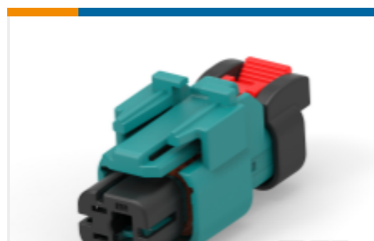
TE 产品编号2355843-1 1POS,COAX,SOC HSG ASSY,SLD