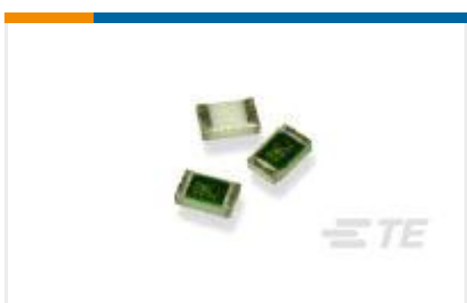
TE 产品编号2-1879338-9 CPF 0603 52K3 1% 50PPM 1K RL