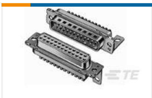
TE 产品编号3-1393480-2 V23529B1122C209=SUB D STIFTLI