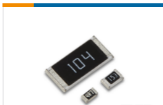
TE 产品编号3-2176347-4 CRGCQ 2010 5K6 1%