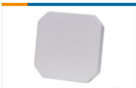
TE 产品编号S8655PRSMF Panel,RHCP,FIXED,SMAF 865-870MHz, 5dBic,