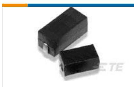
TE 产品编号7-1676966-1 SMW2 82R 5%