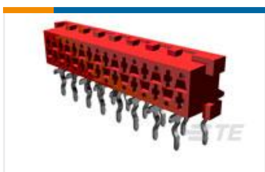
TE 产品编号1-215460-4 MICRO-MATCH FEM.SE