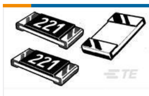
TE 产品编号9-2176231-1 3522 56K 1% 3W