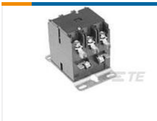
TE 产品编号6-1611010-2 3100-30T10999CG=40A 3P 120V MO