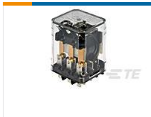
TE 产品编号3-1393118-8 KUP-14D55-24=KU