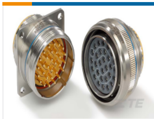
TE 产品编号ZPF0000000000007489 983-0SE 10-05 PN