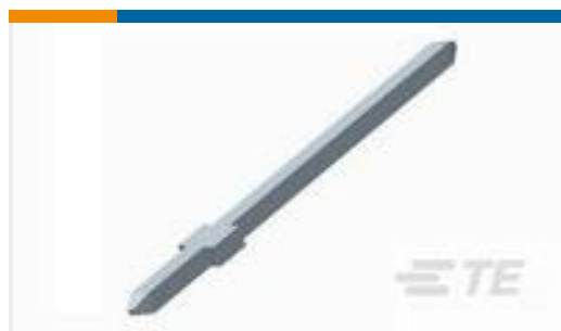
TE 产品编号 1-928836-2 MOD2 PIN WITH A-PIN L/P