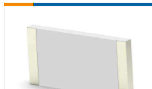
TE 产品编号 7-2176246-6 CRGS2512 5% 1M8