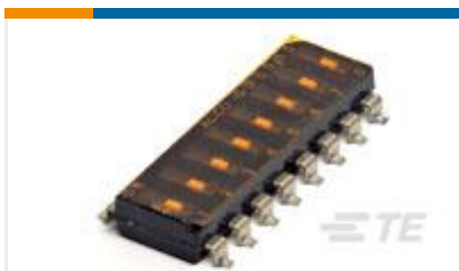
TE 产品编号 1-1825006-9 GDS10S04=DIP SW,SLIDE,SMT