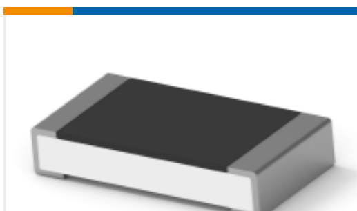
TE 产品编号 4-2176391-7 RQ 1206 37K4 0.1% 10PPM 5K RL