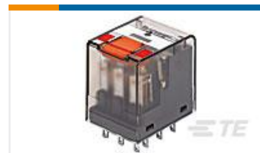
TE 产品编号 3-1415020-1 PT570N20