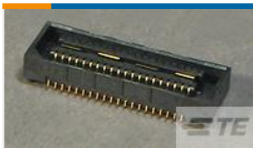
TE 产品编号 7-1658043-1 MSB0.80RC-ASY28DP,GP,F,VCTR