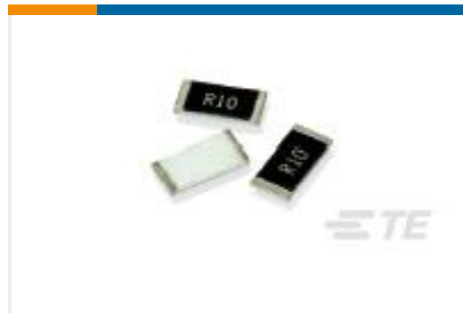
TE 产品编号2-1879461-5 RL73H 2A R13 1% 1K RL