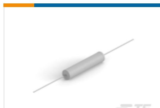
TE 产品编号9-2176415-0 8W STD M/OX 5% 150K