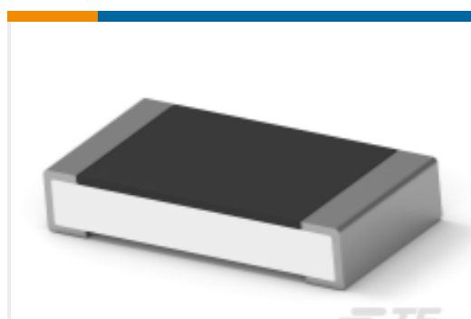
TE 产品编号1-2176391-0 RQ 1206 15K4 0.1% 10PPM 5K RL