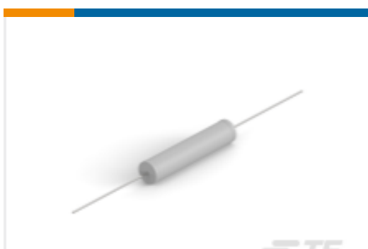
TE 产品编号9-2176415-1 8W STD M/OX 5% 160K