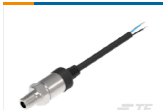
TE 产品编号20014203-12 PRESS XDCR M325M-000005-250PG