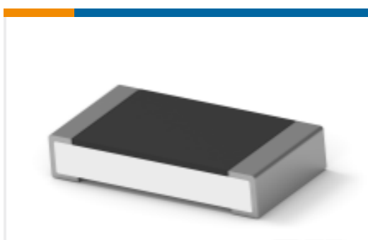
TE 产品编号1-2176389-6 RQ 1206 154R 0.1% 10PPM 5K RL