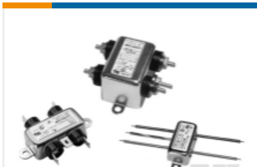
TE 产品编号1-6609021-1 Single Phase Filters, Corcom B Series