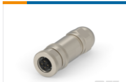
TE 产品编号T4110512041-000 M12 F, 4P GOLD D_CODE S SHIELDED PG9