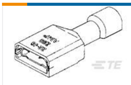
TE 产品编号3-350820-2 ULTRAFast 250 ASSY REC 16-14 TPBR LP