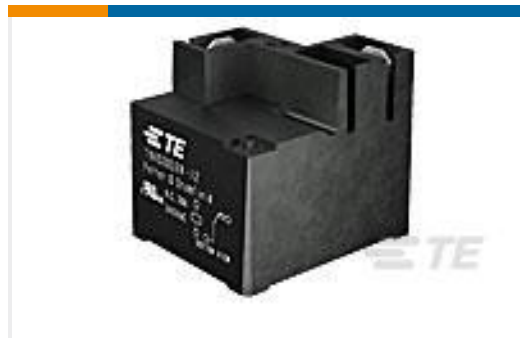
TE 产品编号6-1419102-0 T9AP1D52-12