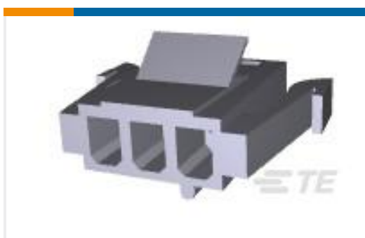
TE 产品编号1-480304-0 03P CMNL PLUG HSG P/M NATL