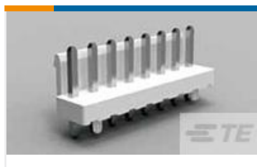
TE 产品编号1744057-5 3.96 EP HDR ASSY 5P W/PEGS