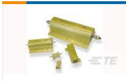
TE 产品编号5-1625984-6 HSA50 3R3 5%